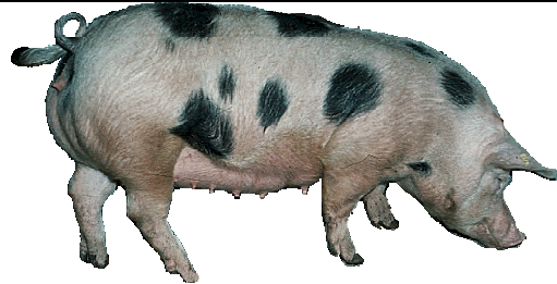
FIGURA 04 - Exemplar da raça Pietran ( www.estpig.ee )

Possui alto rendimento de carcaça, com média-baixa qualidade da carne (a maioria das linhagens, até hoje desenvolvidas comercialmente, são portadoras do gene de sensibilidade ao halotano, ou seja, têm carcaças PSE – carne mole, pálida e exudativa) fato este que está determinando a seleção unicamente de animais halotanos negativos.