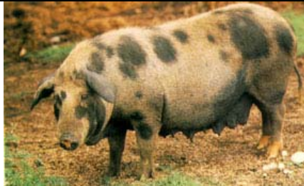
FIGURA 06 - Exemplar da raça Piau

A palavra Piau, de origem indígena, significa "malhado", "pintado". Existem Piaus grandes, médios e pequenos. Alguns ganharam alguma reputação como raça e foram justamente os que resultaram de cruzamentos com raças aperfeiçoadas estrangeiras, como o Goiano, Francano, do Triângulo Mineiro, o Junqueira (só de raças estrangeiras), o de Canchim (São Carlos-SP), o de Piracicaba-SP, o de São José-SP, etc. Um tipo mais fixo e mais antigo é o Caruncho Piau, um pouco maior que o Carunchinho e menor que o Piau. Possui uma variedade vermelha, a Sorocaba, de tamanho médio e aptidão intermediária, provavelmente melhorada por cruzamento com Duroc. Parece-nos que a formação desta raça vem sendo bem orientada para um porco fácil de criar, que possa entrar nos cruzamentos para produção de carne.