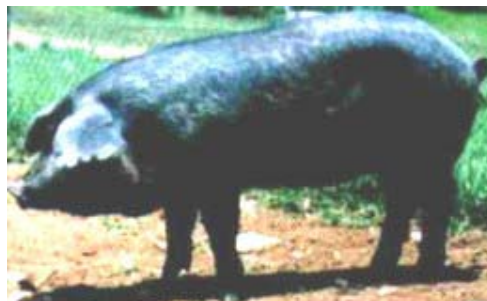
FIGURA 07 - Exemplar da raça Moura

Teve sua origem no Brasil (RS, SC e PR), com pelagem preta entremeada de pêlos brancos (Tordilho) e orelhas intermediárias entre Ibéricas e Célticas, com perfil cefálico retilíneo ou Subconcavilíneo. Apresentam as características de prolificidade, em média de 9 leitões por leitegada, comprimento e rusticidade. É uma raça que está disseminada principalmente nos estados do sul do país.