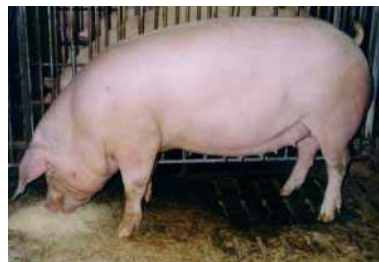
FIGURA 03 - Exemplar da raça Landrace ( www.peipork.pe.ca )

A raça Landrace vem sendo aperfeiçoado pelos Dinamarqueses há mais de um século, visando, além de conformação ideal para a produção de carne magra, excelentes qualidades criatórias. Este objetivo foi conseguido por meio de uma persistente e racional seleção, baseada em prova da descendência. É o que se pode chamar de "tipo clássico" do produtor de carne magra. É uma raça com boa prolificidade, habilidade materna boa, usada para produção de híbridos.