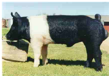
FIGURA 05 - Exemplar da raça Hampshire

Cauda média, ligeiramente enrolada. Membros de médio comprimento, ossatura regular, articulações e cascos fortes, quartelas quase direitas, dispostos em quadrilátero no solo, separados e apumados. Os pernis devem ser compridos, profundos, firmes, sem gordura excessiva, porém lhes faltam, às vezes, espessura e profundidade.