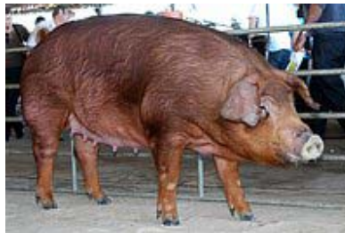
FIGURA 01 - Exemplar da raça Duroc

É originária do Nordeste dos Estados Unidos, proveniente de porcas vermelhas de New Jersey (Jersey Reds) e de varrascos também vermelhos de New York (The Durocs), em 1875. Foi à primeira raça a ser introduzida no país e, portanto, a que iniciou o melhoramento e a tecnificação da suinocultura brasileira. No Brasil já foi à raça estrangeira mais importante, porém hoje ela geralmente participa de cruzamentos com outras raças mais aperfeiçoadas para carne magra.